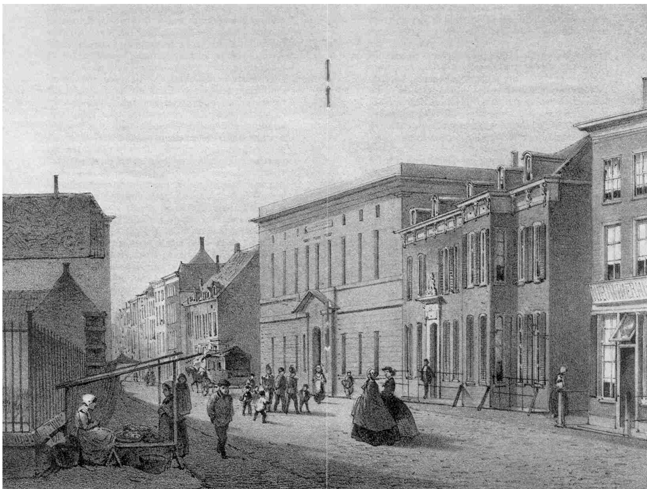
Uit: Album 's-Hertogenbosch in 1860

Geheel in het kader van deze ontwikkeling van het confessionele bibliotheekwezen werd in 1915 in onze stad opgericht de Vereniging "Openbare Leeszaal en Boekerij te Den Bosch", een vereniging die geheel stelde op katholieke beginselen.